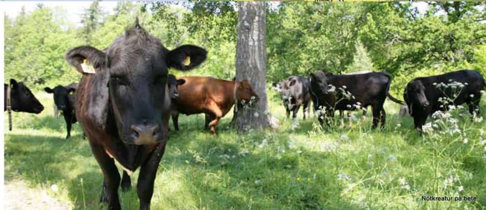
Nötkreatur på bete

nen säger även att man på Gustav Vasas tid skall ha gömt kyrkans dyrbarheter på okänd plats i närheten av källan. 5 Lybäcks sten är en stor sten som ligger i vattenbrynet. På stenen, som är fornnimesmärkt, har hög- och lågvattenmärken ristats in som visar Mälarens tidigare vattenståndsfuktuationer. Dessa markeringar härrör sannolikt från 1600-talet. Enligt hörsägen låg det troligen ett skeppsvarv här på 1600-talet där skeppet Riksnickeln är byggt. 6 Misteln förekommer rikligt på t.ex. Ekholmen. Den växer framförallt på lind och lönn men andra lövträd kan också vara värd för mistlar, dock inte på ek i vårt land. Misteln är Sveriges enda trädlevande parasit. 7 Almiskogarna på t.ex. Sundbyholmsön är värda ett besök. Almen är ett stort träd som kan bli upp till 30 meter högt. Kronan är vid och huvudgrenarna är kraftiga och uppåtsträvande med hängande eller utåtböjda spetsar. Alm hör till ädellövskogens flora och är således vanligast i södra Sverige.